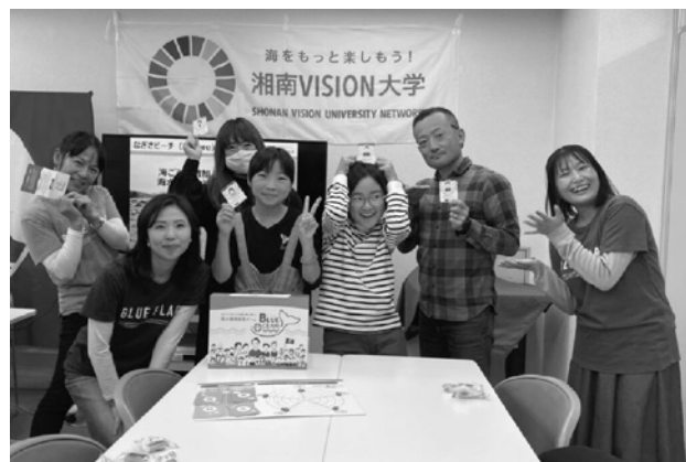
図-10 BLUE OCEAN体験会(左から2人目が筆者)

このように、BLUE OCEANボードゲームは、新たな環境教育の手法として、海洋環境問題への関心を高める機会を提供し、本ゲームを通じて未来の海を守る担い手を育てる一助となることを期待されます(図-10)。