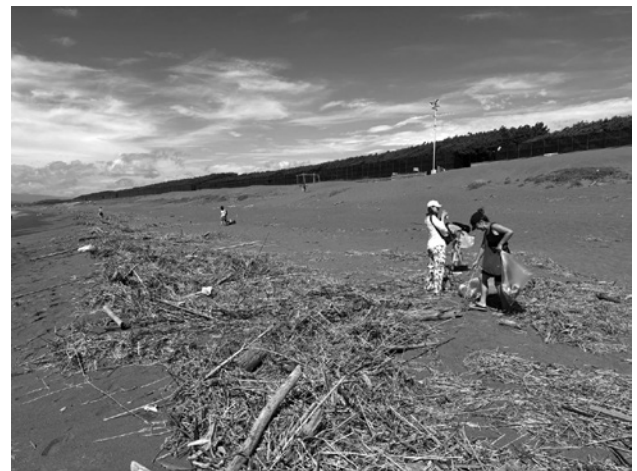
図-1 大量のごみが打ちあがった茅ヶ崎海岸

私たち、「NPO法人湘南ビジョン研究所」（以後、湘南ビジョン研究所とする）は、海の世界教育に特化した「湘南VISION大学」を主催しており、授業の一環として湘南地域の海岸で定期的にビーチクリーンを行っています。また、海ごみに含まれる直径5mm以下の微細なマイクロプラスチックを回収して、市民向けの講座を開催してプラスチックを題材とした海の世界問題の普及・啓発に取り組んでいます。本稿では、これらの取り組みについて報告します。