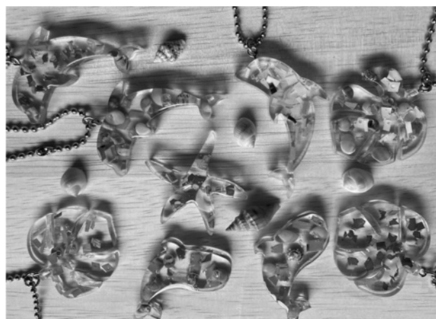
図-8 唯一無二のキーホルダー