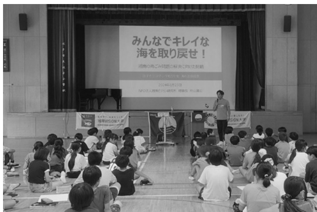
図-11 小学校での海の講演