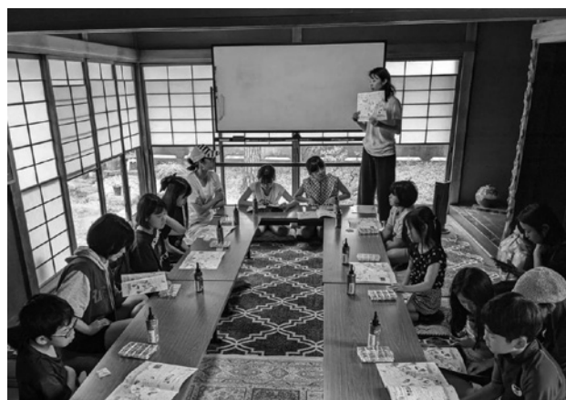
図-7 湘南VISION大学での講義