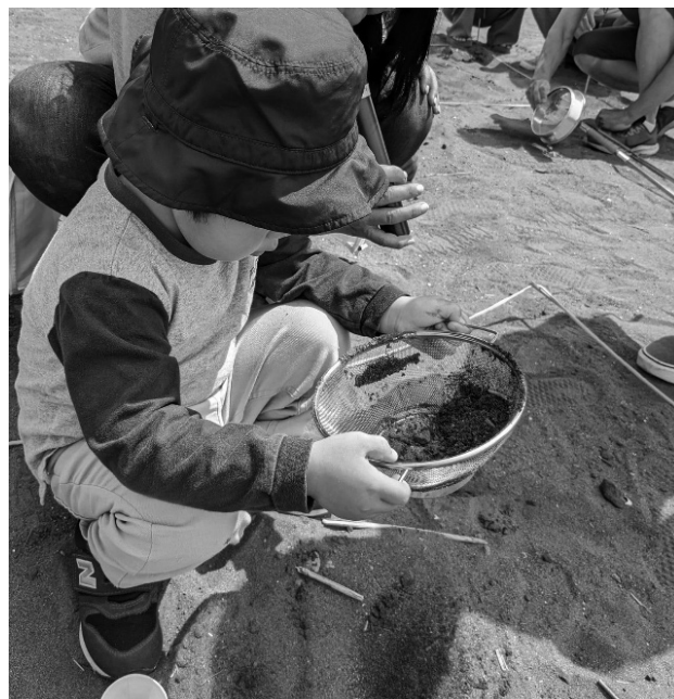
図-6 ザルを用いたふるい分け法

環境教育の実践を通じて、参加者が環境問題への取り組みの重要性を実感する機会となり、楽しさと