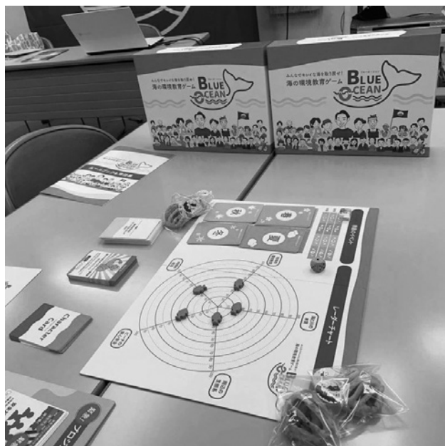
図-9 海的环境教育ボードゲームBLUE OCEAN

当研究所は、日本財団「海と日本プロジェクト」の助成を受け、2023年に海洋環境問題とその解決策を楽しく学べる「海的环境教育ボードゲームBLUE OCEAN」を開発しました(図-9)。このゲームはファシリテーター養成講座を修了した者が司会進行を担うことで、適切な進行と参加者が円滑にゲームを進めながら環境問題への理解を深められるよう設計されています。各プレイヤーは、海に関わるステークホルダー(利害関係者)と協力し合い、複数のプロジェクトを実行することで、海洋環境問題の解決を目指す構成となっています。ミッションは、ブルーフラッグを取得して、キレイで安全・安心で豊かな海を取り戻すことです。BLUE OCEANボードゲームは、海洋環境問題を自分ごととして捉え、自らアクションを起こす人を増やすことで海洋環境問題を解決することを目指しています。