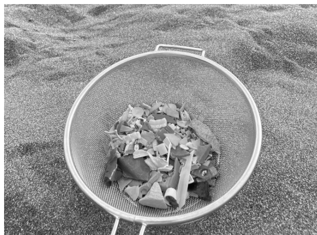
図-5 茅ヶ崎海岸で集めたプラスチック

この自身の経験を踏まえ、マイクロプラスチック問題の課題の一つは、多くの人がその存在を十分に